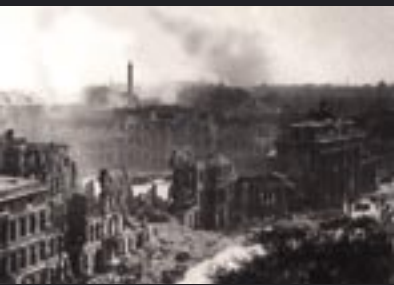
La Porta di Brandeburgo - 1945