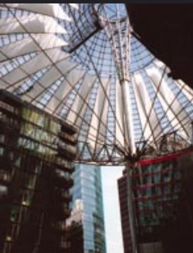
Sony Center Postdamer Platz