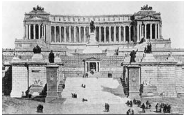
G. SACCONI - Il Vittoriano. Rappresentazione prospettica del progetto vincitore del secondo concorso (1882).