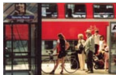
Un sistema misto di trasporti

Berlino. Viaggio piacevolissimo e ben organizzato sotto tutti gli aspetti. I settori d'interesse citati sono tutti condivisibili in tal senso a mio avviso l'urban plannig berlinese, rapportato alle motivazioni economiche e politiche come ci è stato esposto dall'ottimo accompagnatore, rappresentano un importante tema di approfondimento. L'architettura che mi ha più emozionato è stata sicuramente il museo ebraico: l'architettura di qualità deve fra l'altro trasmettere sensazioni forti in rapporto ai suoi contenuti. Ottima la decisione di riservare una parte del tempo a scelte personali di visite. L'esperienza è sicuramente da ripetere.