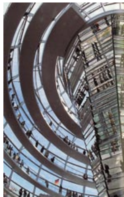
La cupola del Reichstag