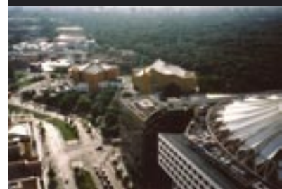
Kulturforum e Sony Center