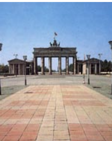
La Porta di Brandeburgo - 1995