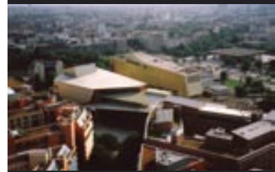
Kulturforum di Scharoun