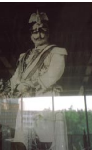
Nationalgalerie - Guglielmo I

Con l'organizzazione di questo viaggio studio INARCH Marche, si è pensato che potesse essere stimolante mettere insieme impressioni, immagini e commenti nel numero 00/2005 InarchMarche Informa . Innanzitutto, perché Berlino? Con la nuova sezione InarchMarche costituita di recente, in settembre 2004, si è voluto avviare un momento d'incontro e di visita di una delle città europee che rappresenta al meglio, con i suoi circa 4 milioni di abitanti, il massimo dell'evoluzione di una grande metropoli. Berlino, oggi può essere la meta per tutti coloro che cercano novità, originalità e innovazione. E' una città testimone dell'architettura, e non solo della Germania degli ultimi due secoli, la sua storia dal 1740 con Federico II il Grande al 1871 con Guglielmo I con le opere dello Schinkel, e la Repubblica di Weimar del 1918, e la Berlino ovest del 1961 con il Muro, e la unificazione della Germania del 3 ottobre 1990, e Berlino capitale del giugno 1991, lasciata dagli alleati nel 1994. Sono tornato a Berlino dopo quattordici anni quando ancora la città veniva definita, almeno per la zona est, "un mucchio di macerie vicino a Potsdam". Ma già ai margini del Tiergarten erano presenti le architetture di Le Corbusier con l'Unité d'habitation, di Gropius con l'Interbau, di Aalto, di Mendelsohn, di Niemeyer e del noto Kulturforum con la Philharmonie di Scharoun e la Neue Nationalgalerie di Mies van der Rohe.