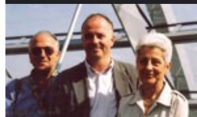
Càpici, Vivori, Polichetti - arch.tti