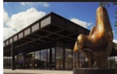
Nationalgalerie di M. v. Rohe