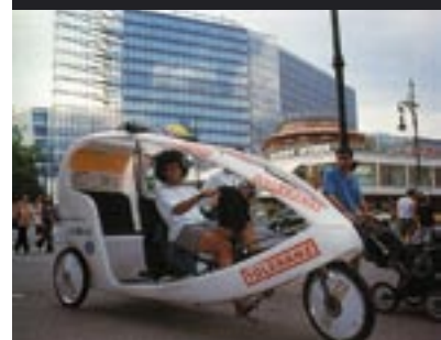
Bizzarro mezzo di trasporto