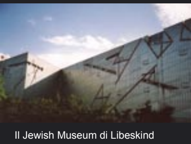
Il Jewish Museum di Libeskind

Oggi, unitamente al current urban plannig, l'interesse massimo è stato rivolto alla contemporary architecture . La ricostruzione attuale della Berlino moderna riguarda maggiormente la zona est dove ancora una volta sono stati chiamati ad operare i migliori architetti in circolazione. Abbiamo percorso tre itinerari, illustrati ottimamente da Marco Vivori architetto operante a Berlino, sfiorando le architetture di Foster, Gehry, Calatrava, Nove I, Piano, Isozaki, Pei, Jahn, Eisenmann e Libeskind. Una bella indigestione di architettura e per tutti i gusti. Da Postdamer Platz di Piano e del Sony Center e al museo ebraico di Libeskind. Le impressioni sono state di forte impatto. Il mio occhio però è per Shinkel, per Scharoun, per Mies van der Rohe per il Daimler-Chrysler-Hochhaus di Piano, e per la cupola in vetro e specchi del Reichstag di Foster, e per la D-Z Bank in Pariser Platz di Gehry.