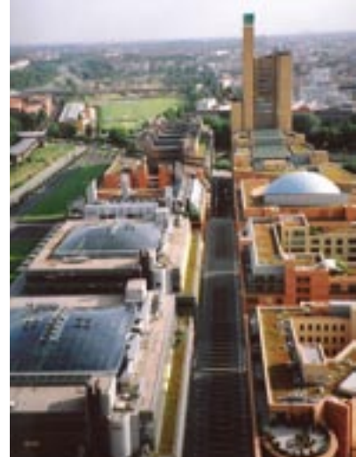
Daimler-Chrysler-Hochhaus di Piano