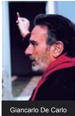
Giancarlo De Carlo