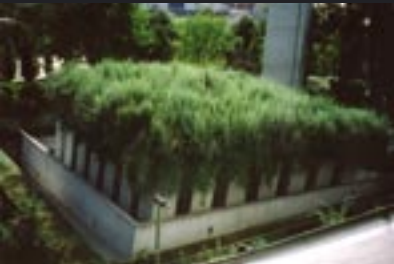
Il Jewish Museum di Libeskind