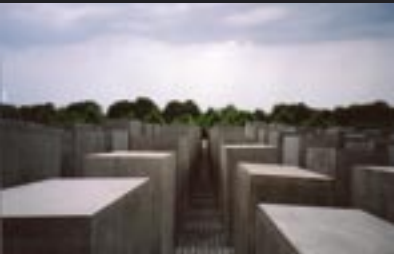
Il Memoriale di Eisenman