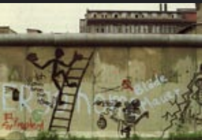
Il muro di Berlino 1988