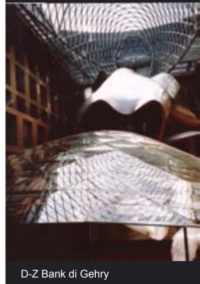
D-Z Bank di Gehry